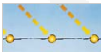
Painel tradicional alumínio / cobre

A utilização dos painéis selectivo na Série "K" da Solahart melhorou o desempenho do "circuito fechado" tornando-o um dos sistemas mais eficazes de aproveitamento de energia solar para o aquecimento de água.